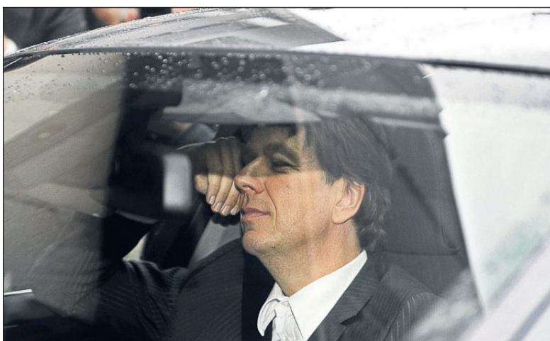
Wirkt abgeklärt: Jörg Kachelmann gestern auf dem Weg zum Gericht.

Kachelmann wurde erst am 20. März bei seiner Rückkehr aus Kanada am Flughafen Frankfurt verhaftet. Er wurde, erzählte der Beamte, von einer jungen Frau abgeholt. Auf dem Weg zum Parkhaus „wurden Zärtlichkeiten ausgetauscht“, berichtet der Beamte. „In Schwetzingen würde man sagen: Rumgeknutsche.“ Der Beamte sprach Kachelmann dann bei seinem Auto an. „Ich habe ihn zur Seite genommen und erklärt, dass ich einen Haftbefehl gegen ihn habe.“ Kachelmann habe „ruhig und abgeklärt“ reagiert.